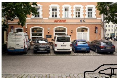
Eine dauerhafte Verbesserung der Platzsituation gemäß der identifizierten Defizite wäre ein großer Erfolg.

Presseberichte, einen Kurzfilm über das Projekt, alle Anträge und Beschlüsse, sowie die Dokumentation der Informationsveranstaltungen finden Sie unter: stadtteilladen-giesing.de/alpenplatz