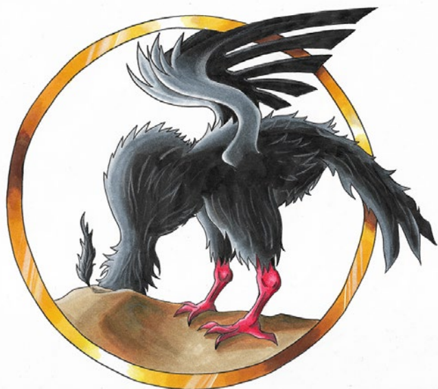
Logo des „Ministeriums für Einsamkeit“, das auf künstlerische Art nach Ursachen, Lösungen und einem besseren Umgang mit Einsamkeit in der Stadt sucht. Zeichnung: Eli Nechyporenko (Instagram: artzyellie)

Täglich werden in München im Durchschnitt fünf Menschen leblos in ihrer Wohnung aufgefunden – ohne dass Nachbarn oder Angehörige davon Notiz nehmen. Immer mehr Menschen dieser Stadt stehen am Lebensende alleine da. Friedhofsangestellte und Seelsorger sind dann oftmals die einzigen, die bei der Beerdigung dabei sind. Auch Krankenkassen schlagen Alarm, denn Einsamkeit birgt ein hohes Erkrankungsrisiko. In Großbritannien gibt es mittlerweile ein Ministerium für Einsamkeit, in Indien ein Ministerium für Glückseligkeit.