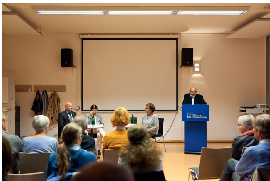
Die Giesinger Gespräche werden durch die Münchner Volkshochschule organisiert und behandeln regelmäßig Themen die Giesing bewegen.

25 Stadtteilbüros, die dezentrale Mitwirkungs- und Entscheidungsstrukturen stärken könnten, hielte er in einer 1,5 Mio.-Stadt für absolut angemessen.