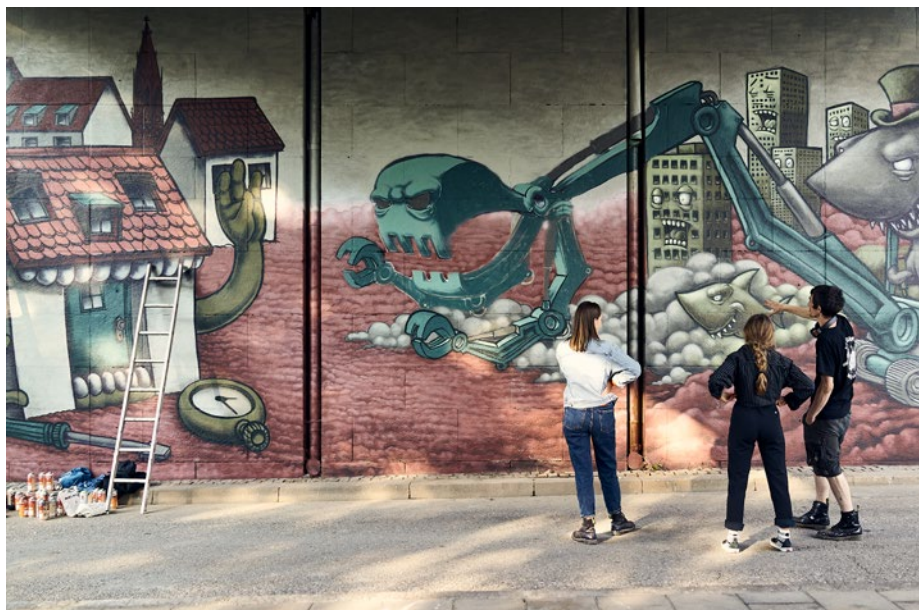
Graffiti am Kolumbusplatz von Heiko Krause von 2018 und Zeichnung von Angela Kirschbaum, die 2017 zu einer spontanen Protestausstellung im FLO** entstand.