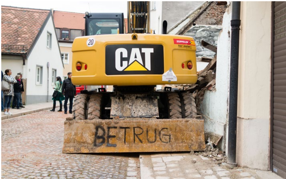
Das Uhrmacherhäusl in 2012 und einen Tag nach dem Abriss im September 2017.

Chronik zum illegalen Abriss des Uhrmacherhäusls vom Winter 2015 bis Heute