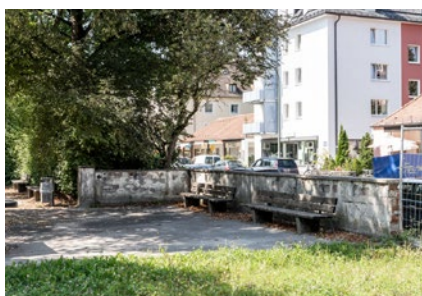
Rechts und unten: Aktuell in Planung: Neugestaltung des Grünsitzes und Umgestaltung des Tegernseer Platzes

Beate Harrer, Referat für Stadtplanung und Bauordnung Torsten Müller, MGS Stadtteilmanagement Giesing