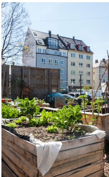
Gießkannen und Hochbeete im urbanen Garten, einem geschützteren Areal auf dem Grünsplatz.