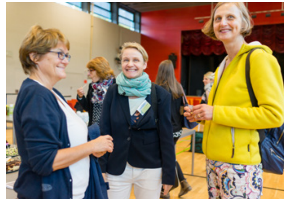
Bei den inklusiven Begehungen gab es viel zu lernen – über Barrieren im öffentlichen Raum, die man zu Fuß oder mit den Augen nicht wahrnimmt.

Zweiter Fachtag Übergang Schule – Beruf an der Mittelschule Cincinnatistraße