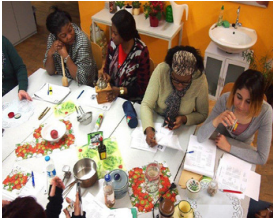
Zwischennutzungen in leerstenden Ladenlokalen (Bild: Kunstinstallation St.-Bonifatius-Straße), Beratung zur Geschäftsgestaltung und Gemeinschaftsaktionen von Gewerbetreibenden – so bleibt das Stadtteilzentrum lebendig und die lokale Ökonomie wird gestärkt.

Qualifizierungsprojekt work&act unterstützt Menschen ins Berufsleben (zurück) zu finden