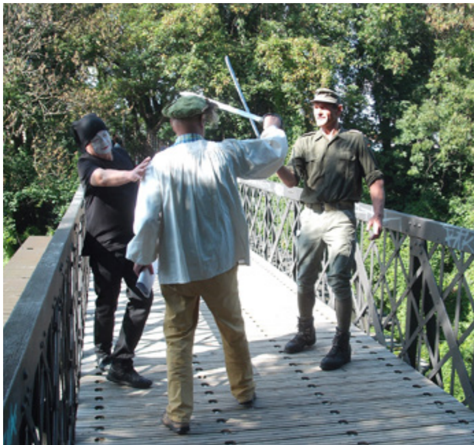
Unter dem Motto Città Vitale waren Interessierte im Dezember 2018 zu einer Aktion auf dem Ostfriedhof eingeladen: Anlass war die Idee, Wohnungen auf dem Friedhof zu bauen – aus der „Befragung der Verstorbenen“ dazu entspann sich rasch eine Diskussion unter den anwesenden Lebenden.

Theaterspaziergang im Rahmen des Faust-Festivals und bei Ois Giasing!