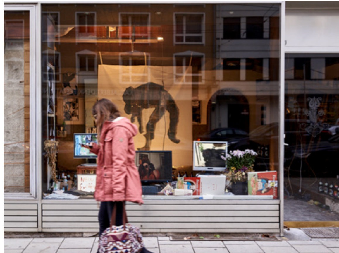
Zwischennutzungen in leerstehenden Ladenlokalen (Bild: Kunstinstallation St.-Bonifatius-Straße), Beratung zur Geschäftsgestaltung und Gemeinschaftsaktionen von Gewerbetreibenden – so bleibt das Stadtteilzentrum lebendig und die lokale Ökonomie wird gestärkt.

Da sich Gewerbetreibende nur für die Nachbarschaft und den Stadtteil einsetzen können, wenn der eigene Laden „läuft“, gab es zahlreiche individuelle Beratungen sowie gemeinsame Qualifizierungsangebote: u.a. Store-Checks sowie Vorträge und Workshops von Experten – zu den Themen Schaufenster- und Ladengestaltung, Kundengewinnung und Kundenbindung sowie Einsatz neuer Medien. Bei den Store-Checks wurden einzelne Betriebe besucht und individuelle Fragen beantwortet. Im Anschluss erhielten die Geschäfte eine Checkliste mit konkreten Ideen. In einigen Geschäften wurde bereits