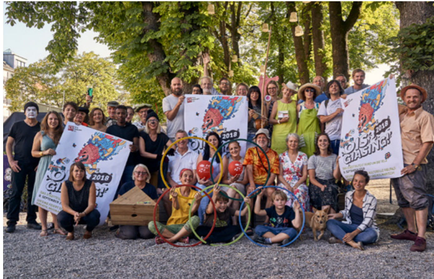
Zwischennutzungen in leerstenden Ladenlokalen (Bild: Kunstinstallation St.-Bonifatius-Straße), Beratung zur Geschäftsgestaltung und Gemeinschaftsaktionen von Gewerbetreibenden – so bleibt das Stadtteilzentrum lebendig und die lokale Ökonomie wird gestärkt.

Die Organisatoren von Real München e.V. im Interview